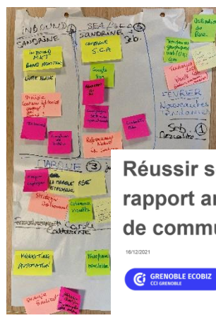
Réussir son rapport annuel d'activité de communication