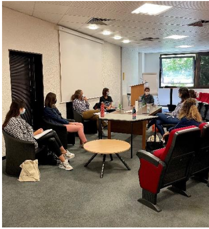
Stratégie de contenu : objectifs et stratégie, gestion du contenu technique, newsletters et emailing 27 mai à la CCI de Grenoble