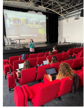
Les événements digitaux : retour d'expérience du CEA Leti, dernières tendances et échange de bonnes pratiques 6 juillet chez Moonshot Labs